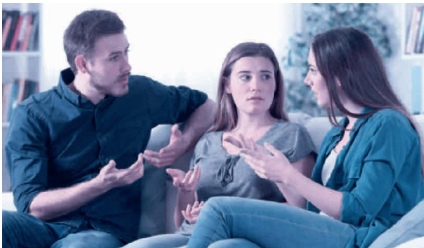
Kommt es zum Streit zwischen den Erben, muss der Willensvollstrecker schlichten.

Der Willensvollstrecker setzt den letzten Willen des Erblassers um. Dafür stellt er als Erstes ein Inventar auf, das er laufend nachführt. Er verwaltet die Erbschaft bis zur Teilung und muss darauf achten, dass das Vermögen erhalten bleibt. Er bezahlt die Schulden des Erblassers inklusive der Todesfallkosten und treibt offene Forderungen ein. Zur Verwaltung gehören auch die laufenden Geschäfte, beispielsweise muss er sich um den Unterhalt von Liegenschaften kümmern, laufende Verträge kündigen oder allenfalls die Liquidation einer Einzelunternehmung umsetzen. Er ist verantwortlich für die Erstellung der