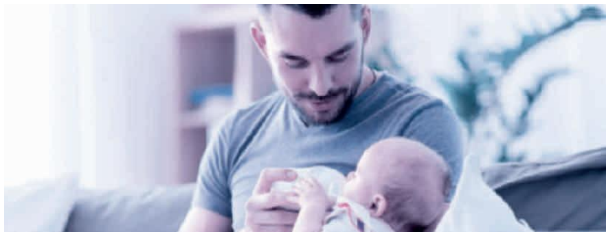
Vaterschaftsurlaub: innert sechs Monaten nach der Geburt zu beziehen.

Das Unternehmen muss dem Vater zehn arbeitsfreie Tage gewähren und hat für diese Zeit Anspruch auf 14 Taggelder. Es ist Sache des Arbeitgebers, bei der Ausgleichskasse – welche auch die EO-Beiträge abrechnet – den Antrag auf die Vaterschaftsentschädigung zu stellen. Der Antrag sollte aber erst gestellt werden, wenn der Arbeitnehmer den ganzen Vaterschaftsurlaub bezogen hat und der Arbeitgeber dies mit dem Antrag bestätigen kann. Die Auszahlung der Vaterschaftsentschädigung erfolgt dann nachgelagert